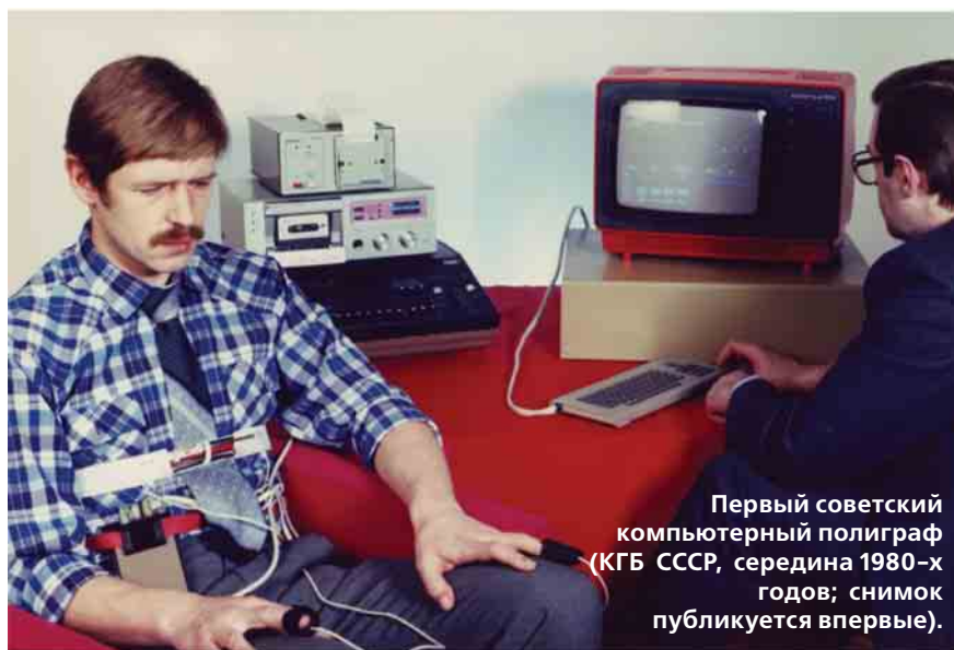
Первый советский компьютерный полиграф (КГБ СССР, середина 1980-х годов; снимок публикуется впервые).

Отечественная практика последующих лет убедительно продемонстрировала, что метод ОИП является эффективной мерой повышения качества отбора кадров, пренебрегать которой при проведении проверочных мероприятий в отношении лиц, претендующих на получение допуска к государственной тайне, едва ли разумно. В частности, данные, представленные органами МВД России осенью 2008 года, свидетельствовали о том, что «до 47 процентов обследованных кандидатов на службу были отнесены к лицам, скрывающим негативную информацию... Итоги отражают неблагоприятную, но реальную качественную характеристику кандидатов на службу в правоохранительные органы... В структуре случаев сокрытия негативной информации преобладают: немедическое употребление наркотических средств, (...) совершение уголовно наказуемых деяний, устойчивые личные и деловые связи с криминальными элементами, пристрастие к азартным